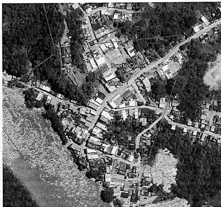
Foto satelital del lugar del sitio de ejecución dentro del municipio