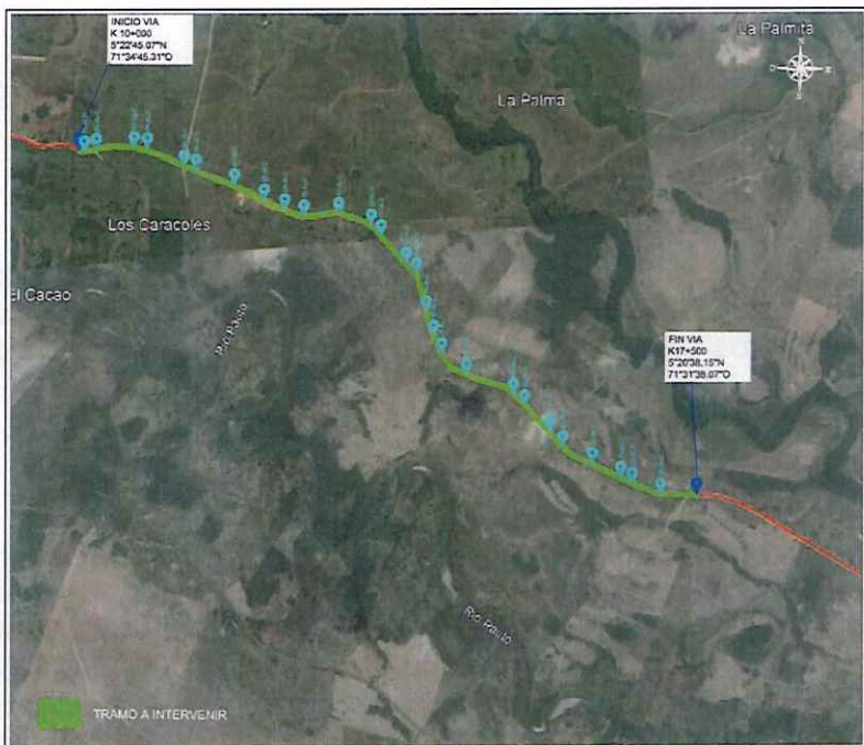
Ilustración 1 Localización de la vía a intervenir en el municipio de Trinidad