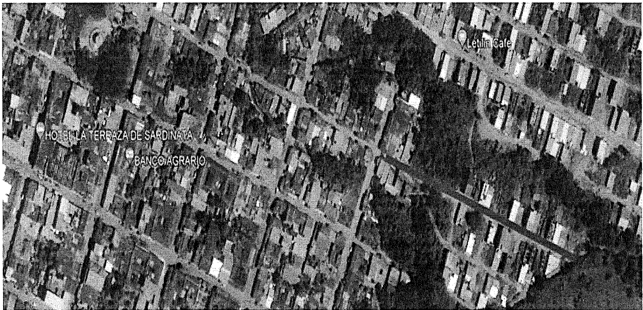
Ilustración 5 Localización de las vías calle 7 entre carreras 0 y 3

ASOCIACIÓN SUPRADEPARTAMENTAL DE MUNICIPIOS PARA EL PROGRESO