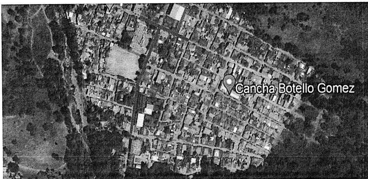
Ilustración 1 Localización de las vías carrera 4 entre calles 1, 1A, 1B, 2, 3 y 4; calle 4 entre carreras 5 y 4; calle 4 entre carreras 4 y 3

De acuerdo con el alcance de los estudios, a los trabajos pendientes por ejecutar a la fecha y la disponibilidad de recursos, la Secretaría de Planeación Municipal realizó la localización de las vías a atender, las cuales se ubican dentro del casco urbano del municipio de Sardinata – Norte de Santander.