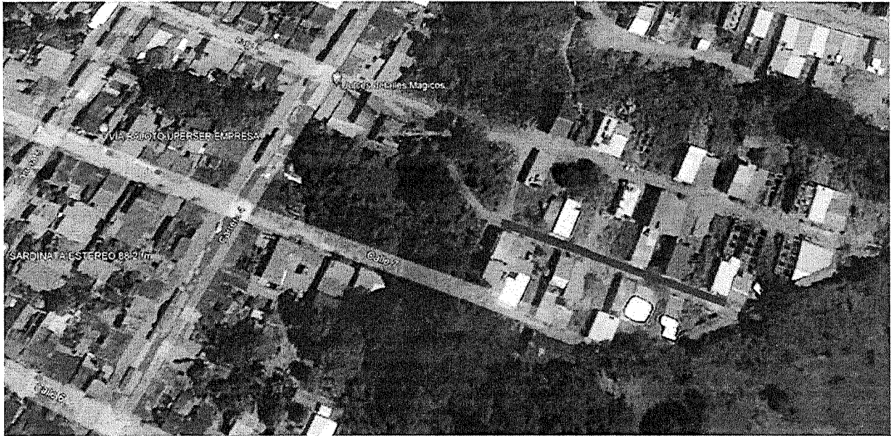
Ilustración 4 Localización de las vías calle 6-A entre carreras 1 y 2