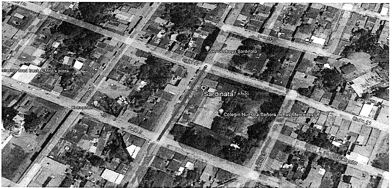
Ilustración 3 Localización de las vías carrera 5 entre calles 8 y 9