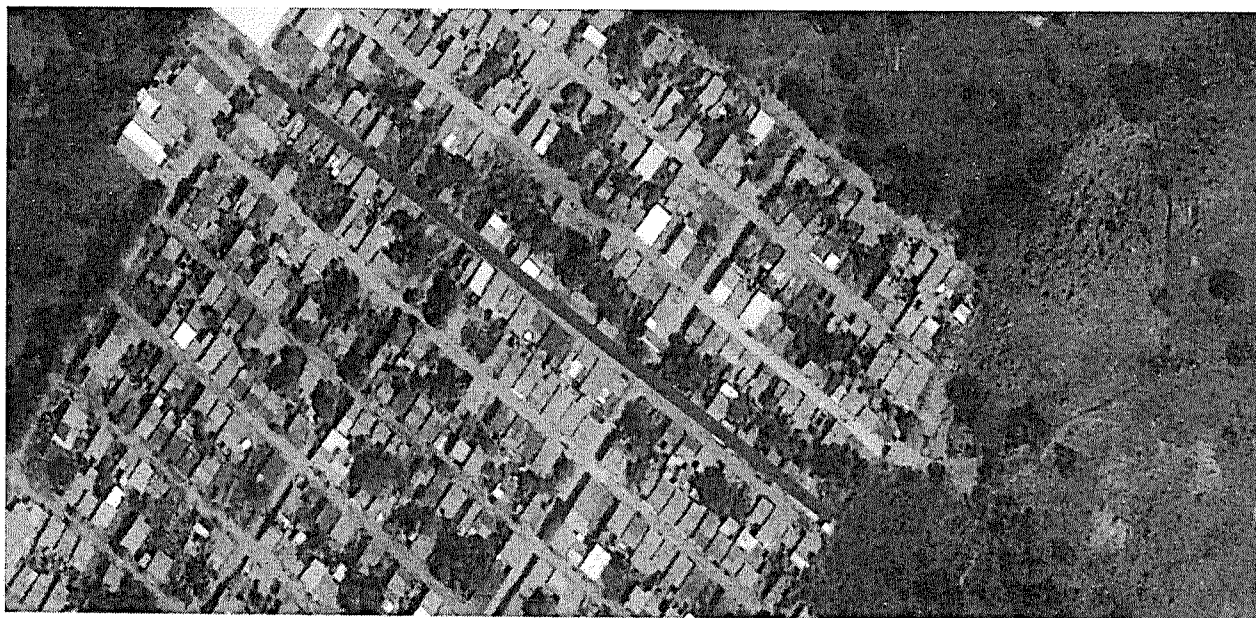
Ilustración 7 Localización de las vías calle 4 del barrio el Baho entre carreras 1 y 4