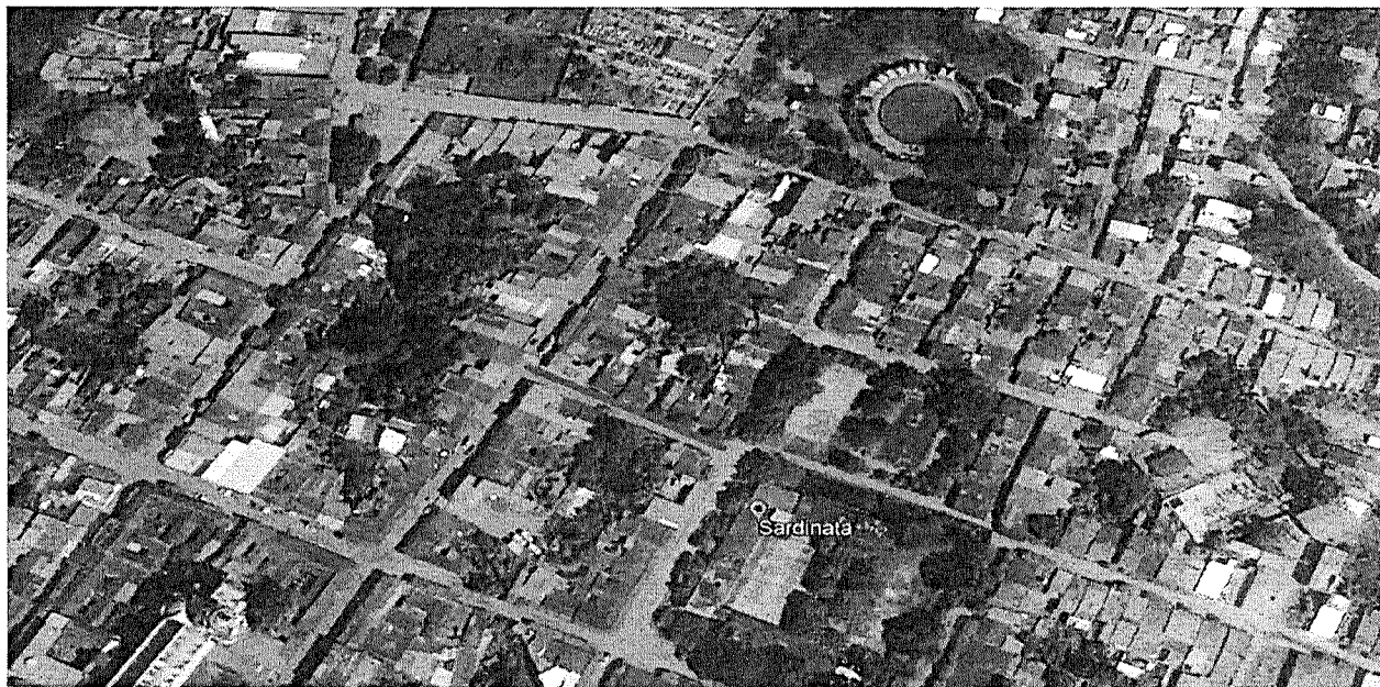
Ilustración 6 Localización de las vías calle 9 entre carreras 5 y 6