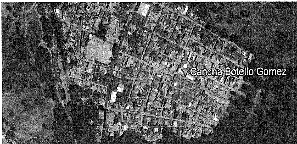
Ilustración 1 Localización de las vías carrera 4 entre calles 1, 1A, 1B, 2, 3 y 4; calle 4 entre carreras 5 y 4; calle 4 entre carreras 4 y 3

De acuerdo con el alcance de los estudios, a los trabajos pendientes por ejecutar a la fecha y la disponibilidad de recursos, la Secretaría de Planeación Municipal realizó la localización de las vías a atender, las cuales se ubican dentro del casco urbano del municipio de Sardinata – Norte de Santander.