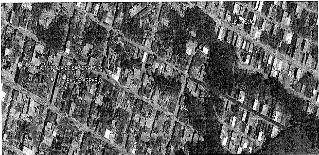
Ilustración 5 Localización de las vías calle 7 entre carreras 0 y 3

ASOCIACIÓN SUPRADEPARTAMENTAL DE MUNICIPIOS PARA EL PROGRESO