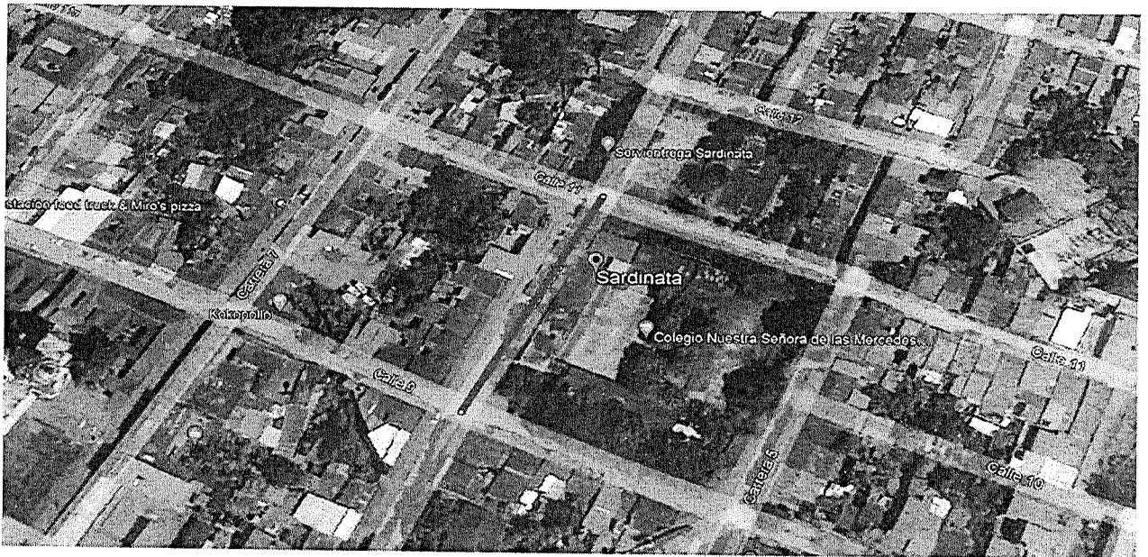
Ilustración 3 Localización de las vías carrera 5 entre calles 8 y 9