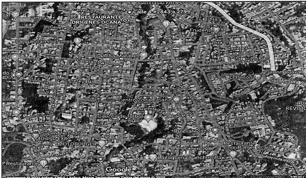
Ilustración 1 Localización del municipio de Ocaña

De acuerdo con el alcance de los estudios, a los trabajos pendientes por ejecutar a la fecha y la disponibilidad de recursos, la Subsecretaría de Vías e Infraestructura Municipal realizó la localización de las vías a atender, las cuales se ubican dentro del casco urbano de Ocaña.