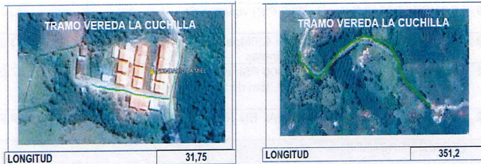
Ilustración 1 Localización del municipio de Marmato