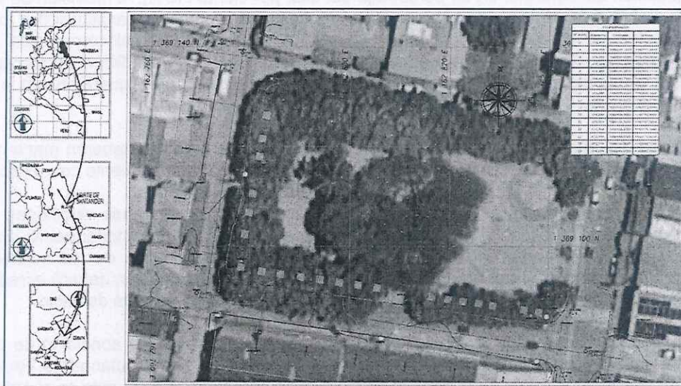
Ilustración 1 Localización del proyecto dentro del municipio de El Zulia.