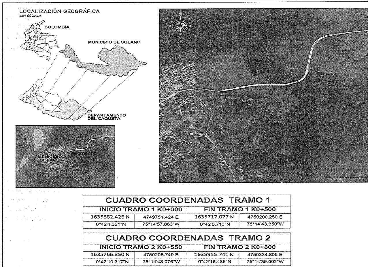
Ilustración 4 Localización de la vía a intervenir en el municipio de Solano

El proyecto se encuentra ubicado en la zona rural del municipio de Solano, en la vía que comunica el casco urbano con la vereda Tres Esquinas, en una longitud a intervenir de 0,75 kilómetros.