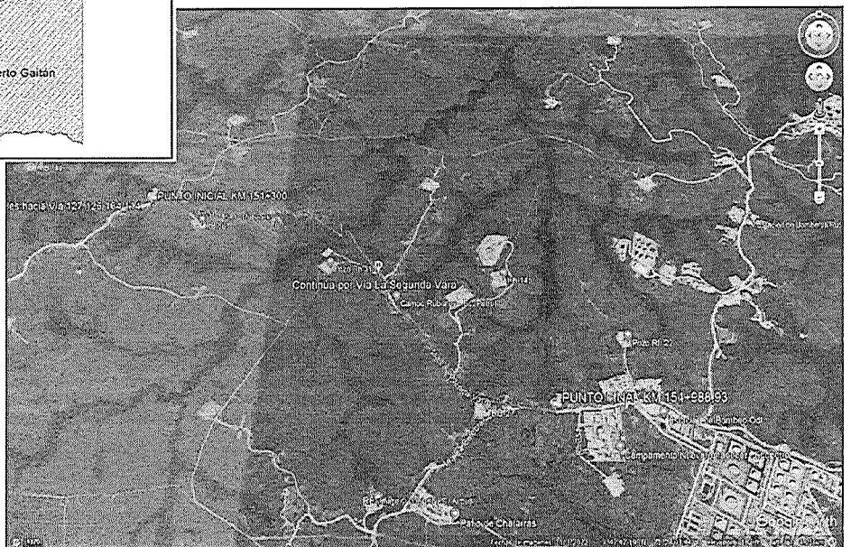
Ilustración 4 Localización de la vía a intervenir en el municipio de Puerto Gaitán