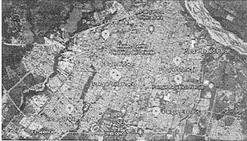
Ilustración 2. Localización Específica del proyecto

El área de influencia directa del proyecto – AID, son los parques Oasis, Alcaraván, Dalel Barón, Villa Nelly, Villa del Prado, Morichal, Comcaja, Villa Roció y Faisan, en los cuales se realizarán las actividades de modernización del sistema de alumbrado público, con la finalidad de generar espacios iluminados y seguros, garantizando el uso de estos escenarios deportivos.