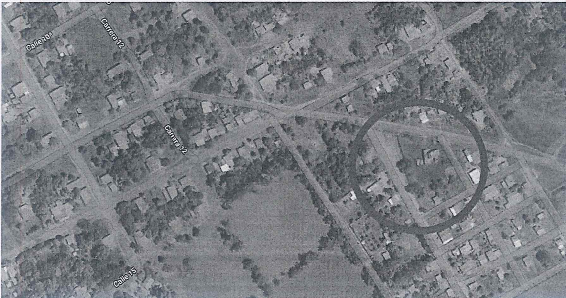
Ilustración 1 Localización del predio del barrio el triunfo en el Municipio de La Primavera - Vichada