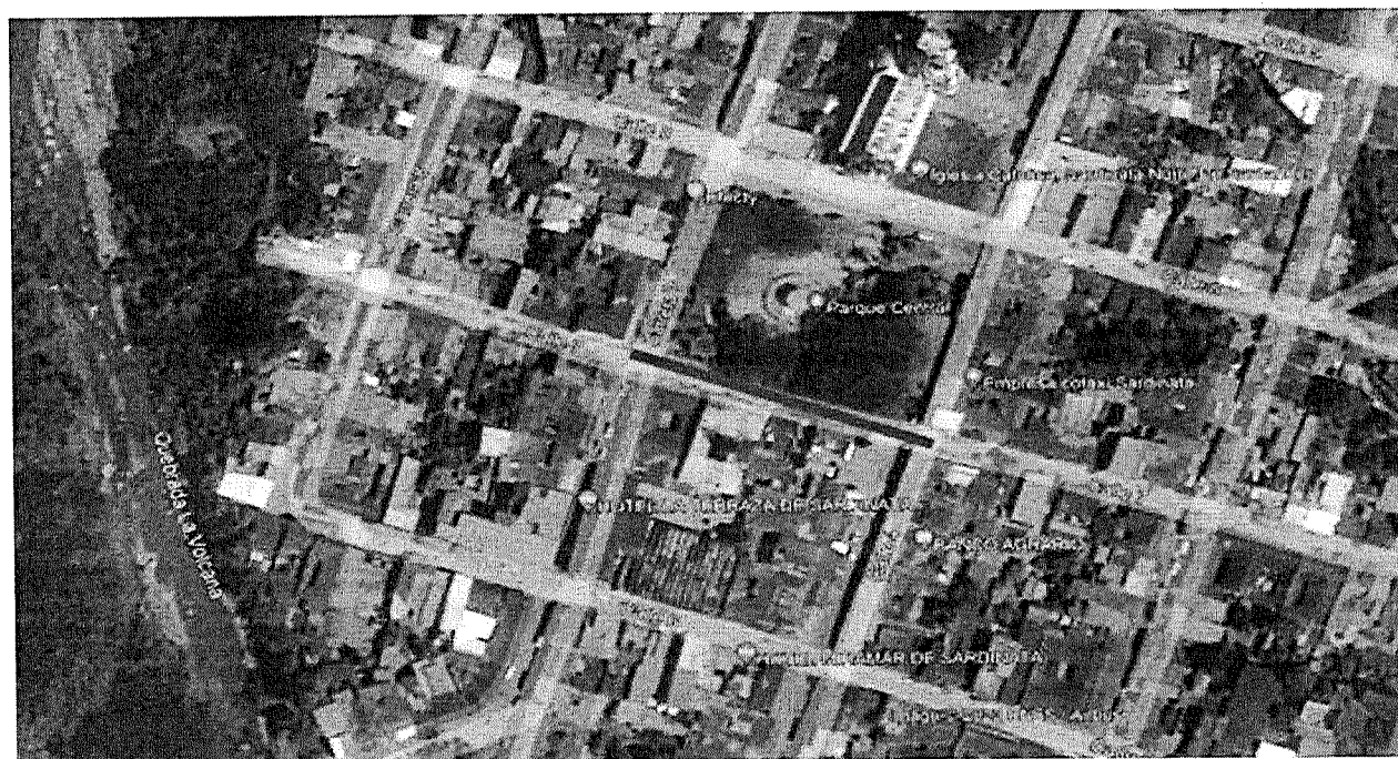
Ilustración 2 Localización de las vías calle 6 entre carreras 7 y 6 Brr. Centro