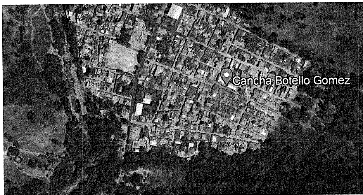
Ilustración 1 Localización de las vías carrera 4 entre calles 1, 1A, 1B, 2, 3 y 4; calle 4 entre carreras 5 y 4; calle 4 entre carreras 4 y 3