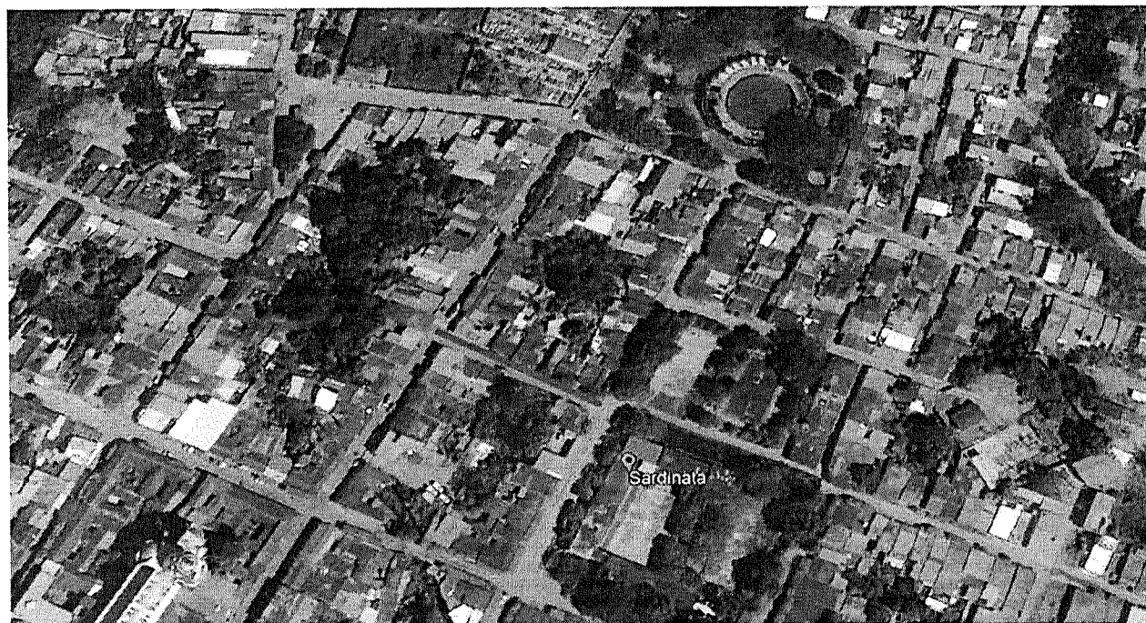
Ilustración 6 Localización de las vías calle 9 entre carreras 5 y 6