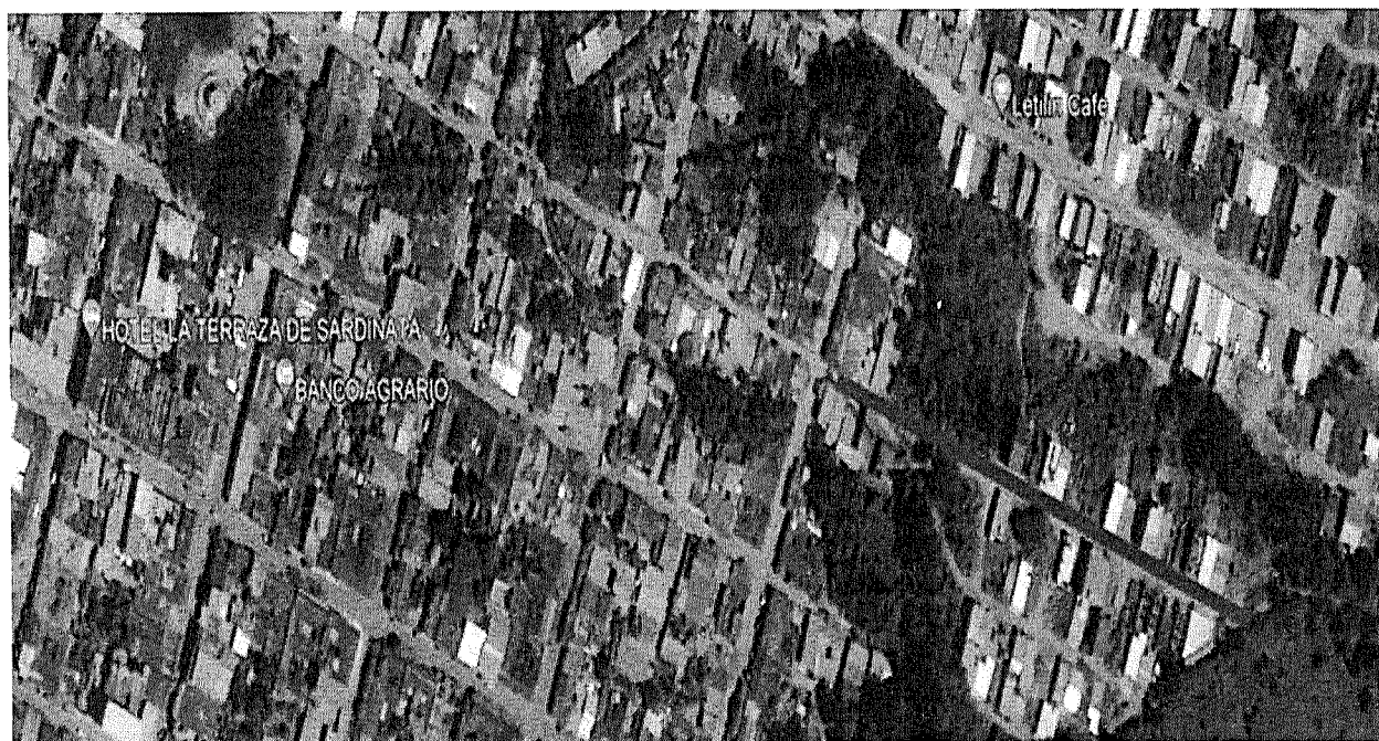
Ilustración 5 Localización de las vías calle 7 entre carreras 0 y 3