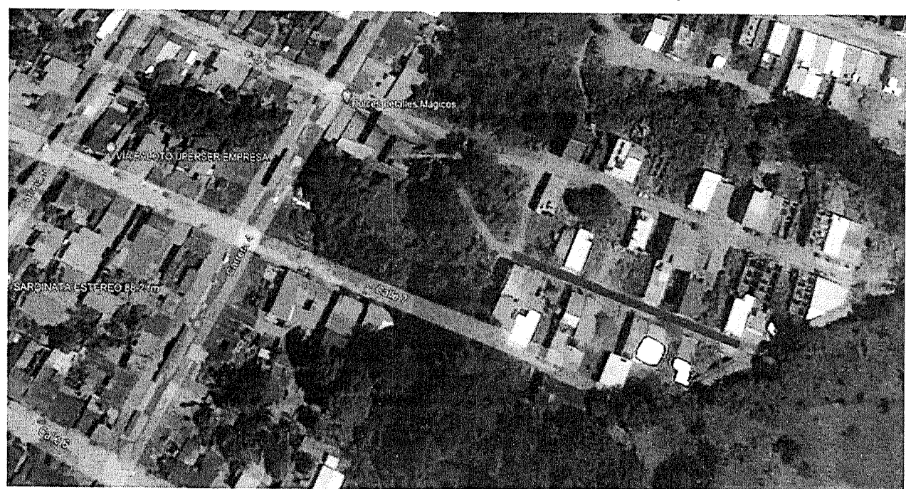
Ilustración 4 Localización de las vías calle 6-A entre carreras 1 y 2