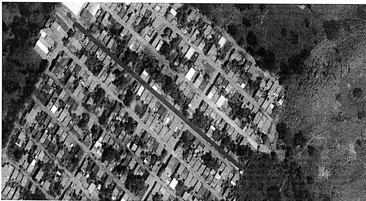
Ilustración 7 Localización de las vías calle 4 del barrio el Baho entre carreras 1 y 4