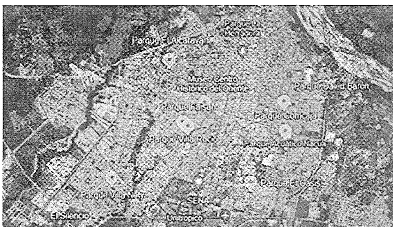
Ilustración 2. Localización Específica del proyecto

El área de influencia directa del proyecto – AID, son los parques Oasis, Alcaraván, Dalel Barón, Villa Nelly, Villa del Prado, Morichal, Comcaja, Villa Roció y Faisan, en los cuales se realizarán las actividades de modernización del sistema de alumbrado público, con la finalidad de generar espacios iluminados y seguros, garantizando el uso de estos escenarios deportivos.