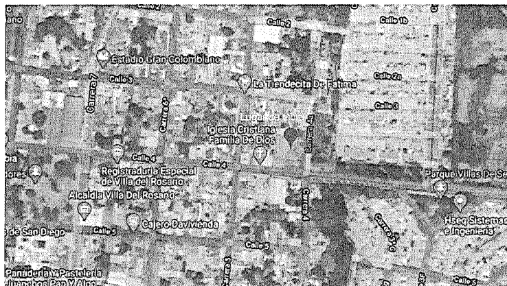
Foto satelital del lugar de la obra dentro del municipio