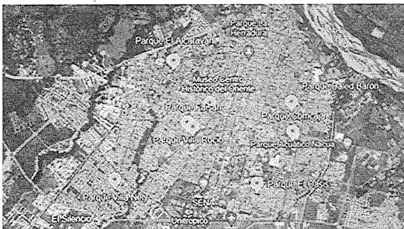
Ilustración 2. Localización Específica del proyecto

El área de influencia directa del proyecto – AID, son los parques Oasis, Alcaraván, Dalel Barón, Villa Nelly, Villa del Prado, Morichal, Comcaja, Villa Roció y Faisan, en los cuales se realizarán las actividades de modernización del sistema de alumbrado público, con la finalidad de generar espacios iluminados y seguros, garantizando el uso de estos escenarios deportivos.