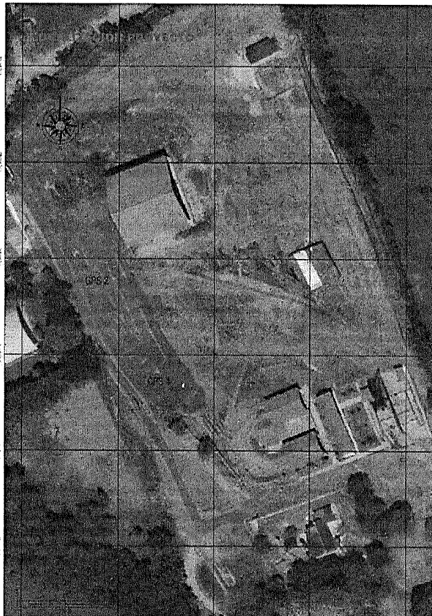
Ilustración 1 Localización del área a intervenir en el municipio de El Paujil