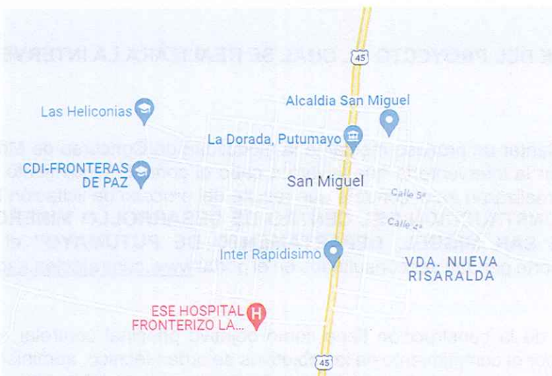
Ilustración 1 Localización del municipio de San Miguel