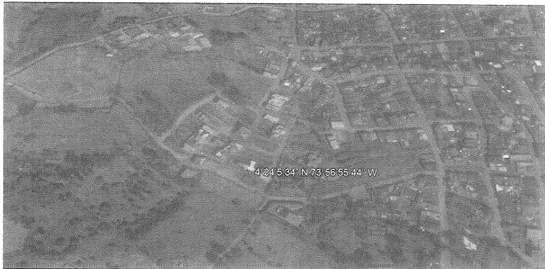
Figura 1.1. Coordenadas lugar del proyecto.